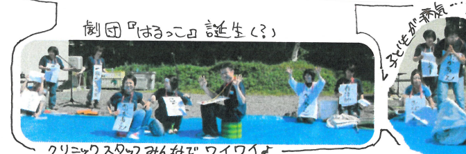
クリニックスタッフみんなワイワイ

この冬開所予定の、病児保育所「はるっこ」。病児保育所とは、病気のときで子どもたちが適切な支援を受けられるように、病気の看護と子どもの保育が一体化した、一時預かり保育所です。また、「はるっこ」では病気の最中～病後(回復期)までのお子さんのご利用のほかに、自宅での看護に不安がある方の見学も可能に予定しています。そんな、病児保育のシステムや役割、「はるっこ」の特色も含めて「たのしく・わかりやすく」をモットーに、クリニック職員による寸劇「病児保育ってなに?」をお送りしました。暑い日差しの中たくさんのお子さんたちが、シートに座って、間近で見え、一緒に笑ってくれましたよ！また、今後は工事の音や駐車場の面で、みなさまにご迷惑をおかけいたしますが、ご理解ご協力をよろしくお願いいたします。